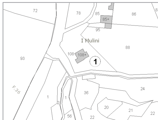
Estratto di Mappa Catastale