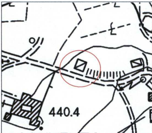
Estratto di CTR - scala 1:5.000