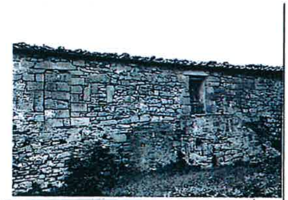
RILIEVO LR 59/1980