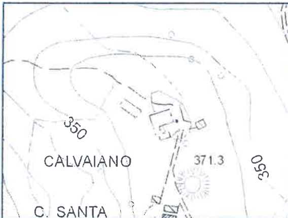
Estratto di CTR - scala 1:5.000