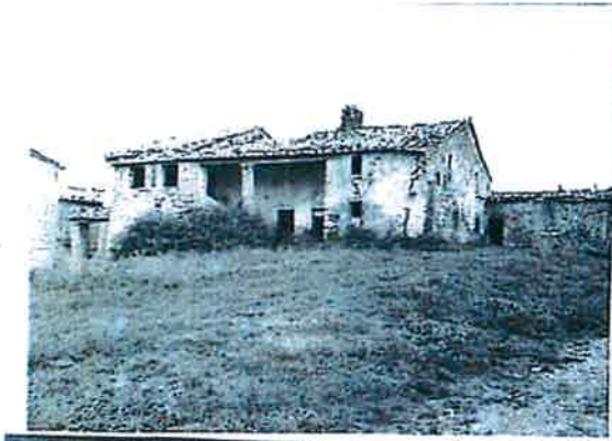
RILIEVO LR 59/1980