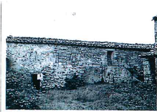
RILIEVO LR 59/1980