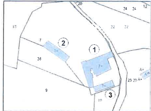
Estratto di Mappa Catastale